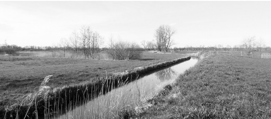
Hjir begjint DeLauwers

floed fan de see ryklik klaaiich wie. En dêrom net goed brâne woe. Dizze streek leit yn it oergongsgebiet fan klaai nei sân. Lâns de Lauwers is hjir in natuerpaad útset. In Bleatefuottenpaad sels. Hjir kom ik fêst in kear werom. Der komt wer mear bewenning. Peebos hjit it hjir. Ik sjoch in moaie grutte tún en by in útspanning, it is in teetún. Der bin minsken yn de tún oan it wurk. Simmers is it hjir fêst in