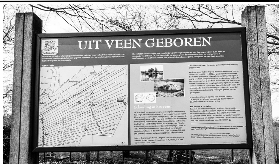
Ynformaasje oer Puntpeal en omjouwing

ta. Ek hjir folget de wei presys de grins. De Skieding is de namme ek noch fan dizze dyk. Links en rjochts is iepen fjild en der steane grutte boerepleatsen. By Fryskepeallen stiet wer in grinspeal. Dy stiet hjir op in plak wer't in sk ns, in f sting, west hat. Hjir ferdigene de befolking harren tsjin de soldaten fan Bommen Berend, de biskop fan M nster. Dy hie it foarsjoen op de st d Grins. Fan de oarspronklike sk ns hat men koartlyn in model neiboud. Yn de foarm fan in fjouwerkant fan hege ierden wallen. Der stiet ek in monumintsje. Ik fyn it moai makke. Noch in lyts eintsje en ik bin yn it doarp. De bus komt ek al gau. Ik reizgje fia Drachten mei de bus nei Hearenfean. Mei it spoor kom ik wer th s. It wie wer in skoane dei.