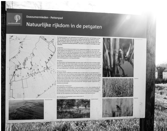
Ynformaasje oer de Doezumermieden

greiden fan it natuergebiet haw ik efter my litten. It lân wurdt stadichoan sânich en drûger. Der komt in sydwei yn de rjochting fan Doezum. Dy folgje ik